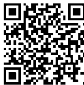
QR Platba - Sbor