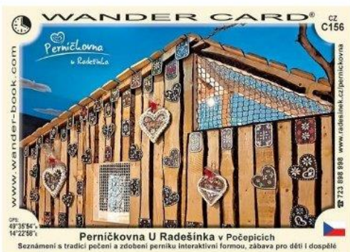
Perníčkovna U Radešinka v Počepicích

vnější průměr 13,5 m výška zdiva 18 m Torzo zděný jednoho z nejkrásnějších, největších a nejstarších větrných mlýnů v Evropě