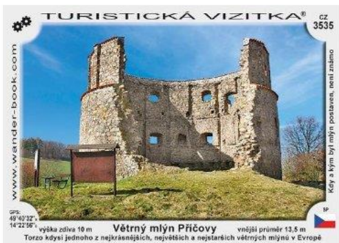
Větrný mlýn Příčovy

a na závěr si budeme sami moct perníčky nazdobit a odvézt domů. Po exkurzi a workshopu se ještě autobusem přesuneme kousek na větrný mlýn Příčovy . Odtamtud už vyrazíme zpátky do Prahy. Návrat je plánovaný na 17:00 opět Na Knížecí. Až na část prohlídky zámku a vstup do autobusu je program bezbariérový. Pokud víte, že potřebujete nebo byste ocenili vozík a nemáte svůj, dejte nám prosím vědět, abychom zajistili jejich dostatek. Pokud máte svůj, určitě si jej vezměte s sebou a také prosím dejte vědět, jestli byste na výletě ocenili dobrovolnickou pomoc. Účastnický poplatek je 100 Kč jako příspěvek na dopravu. Jinak je vše, včetně oběda, hrazeno Petrklíčem.