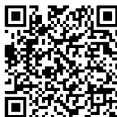
QR Platba - Misie

P.S. Omlouváme se všem, na které jsme zapomněli. Nebyl to úmysl.