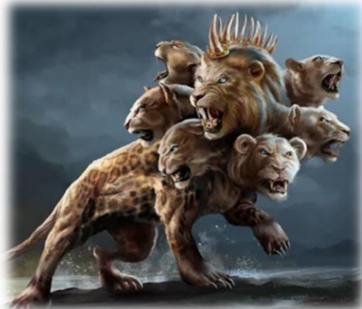
Michael a jeho andělé se utkali s drakem.

Při přemýšlení o svobodě a o těch, kteří se nás o ni snaží připravit, bychom neměli zapomínat na bytost stojící v pozadí. Kdo dává moc šelmě, která je symbolem politického katolicismu? Jan píše: „ Ta šelma, kterou jsem viděl, byla jako levhart, její nohy jako tlapy medvěda a její tlama jako tlama lví. A drak jí dal svou sílu i trůn i velikou moc “ (Zjevení 13,12).